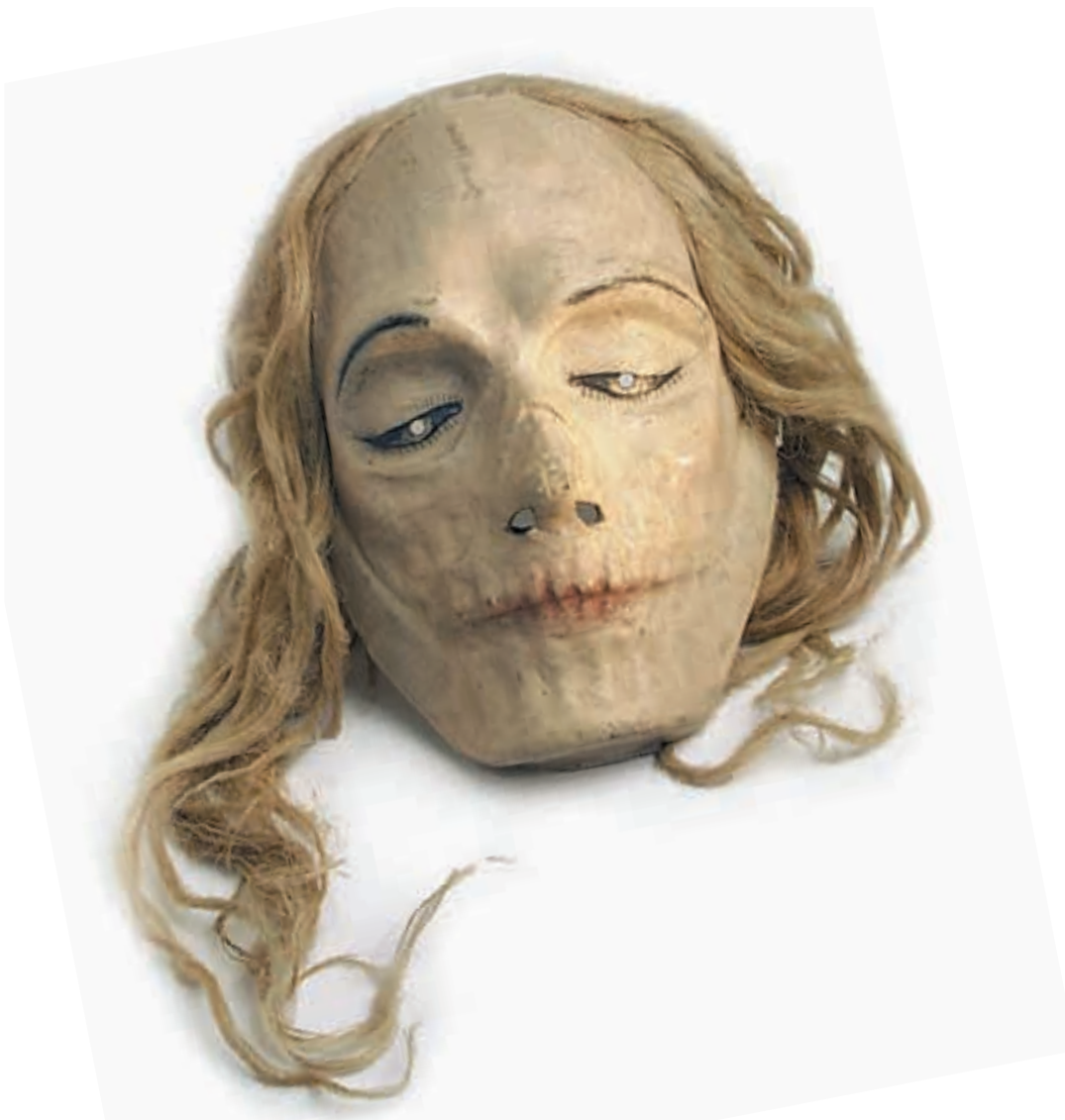
Máscara de Jesús Costa para 'O lapis do carpinteiro'